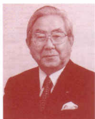
北海道少年少女合唱連盟会長