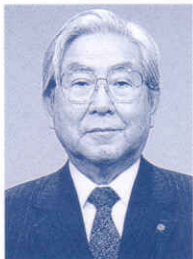
北海道少年少女合唱連盟会長