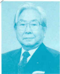
北海道少年少女合唱連盟会長 北海道放送株式会社社長