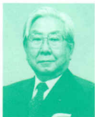
北海道少年少女合唱連盟会長 北海道放送株式会社社長